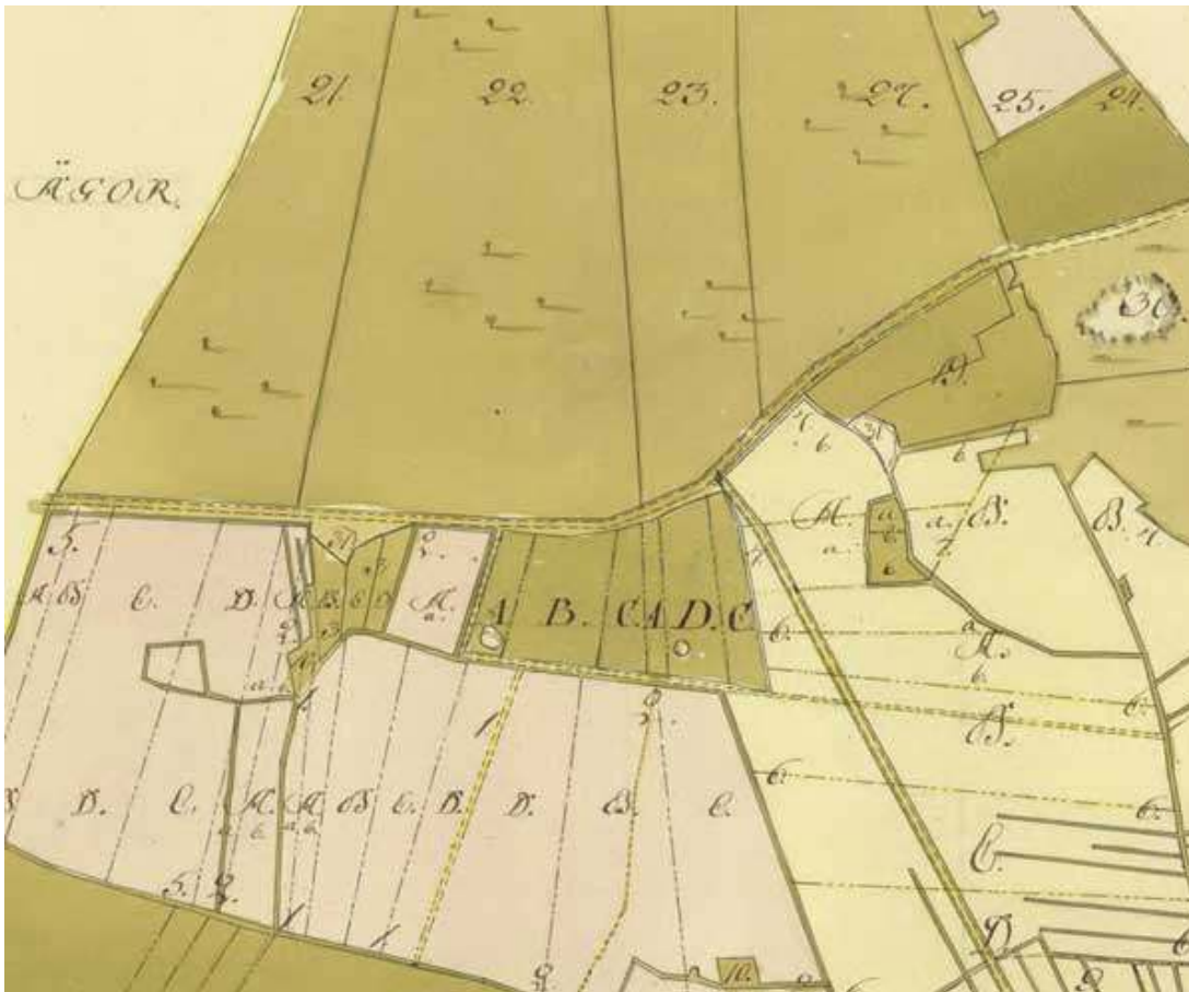
Storskiftes kartor 1771-1773