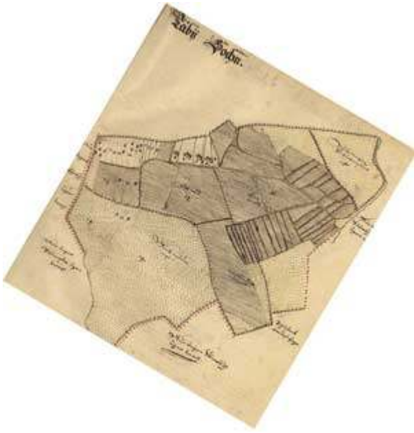
Kartan 1650 vriden cirka 25 grader