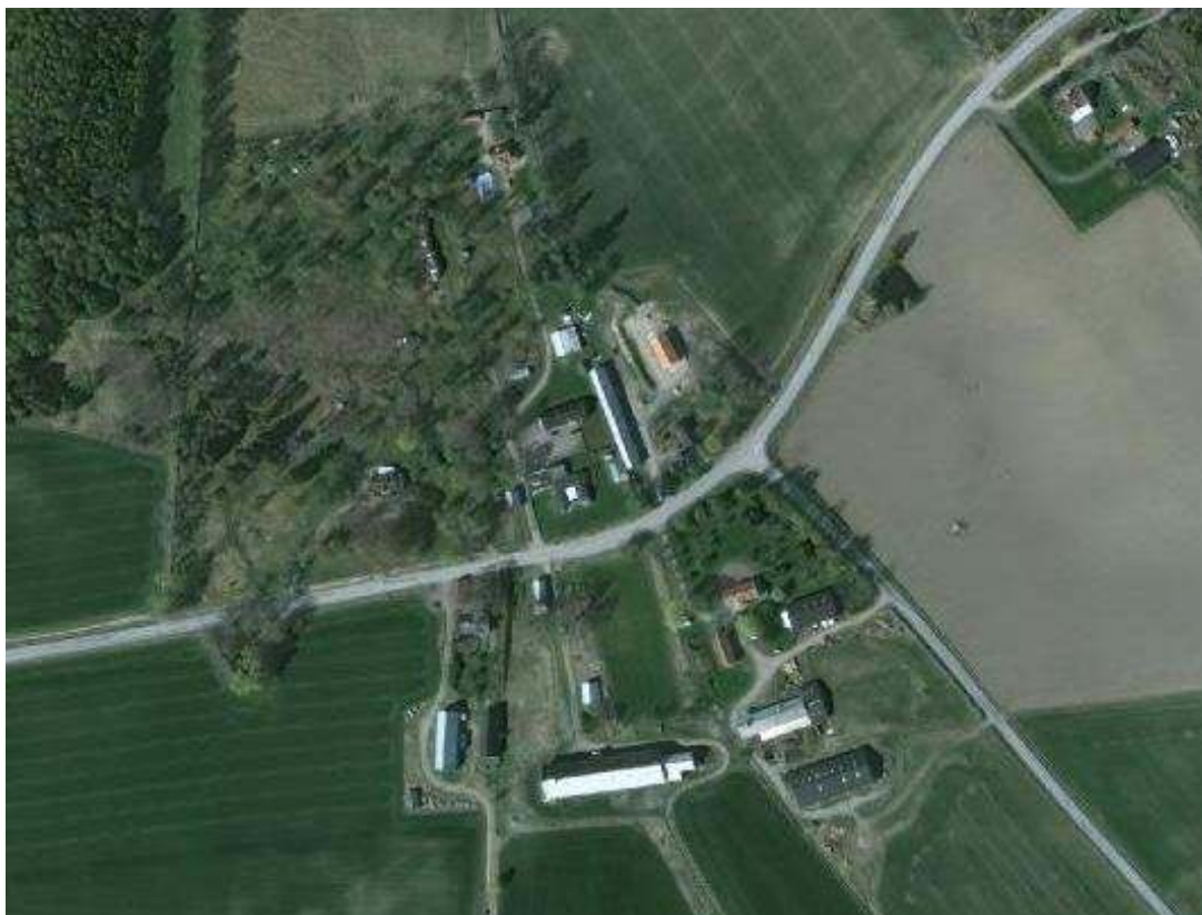
Flyfoto 2000 talet