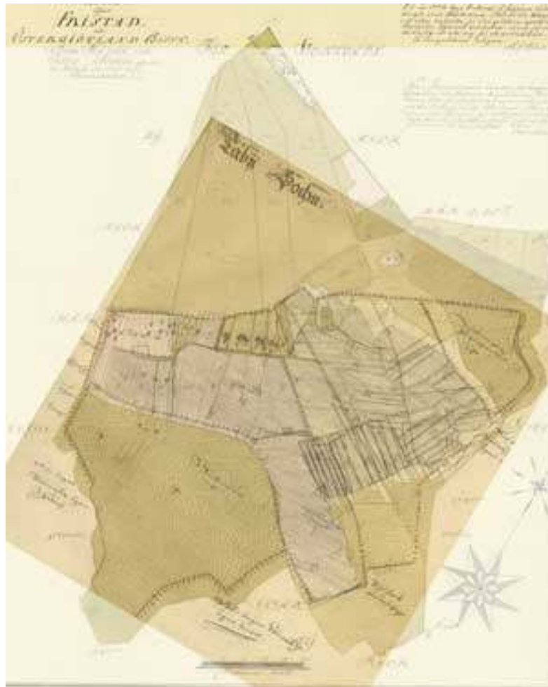
Båda kartorna sammanslagna med opacitet