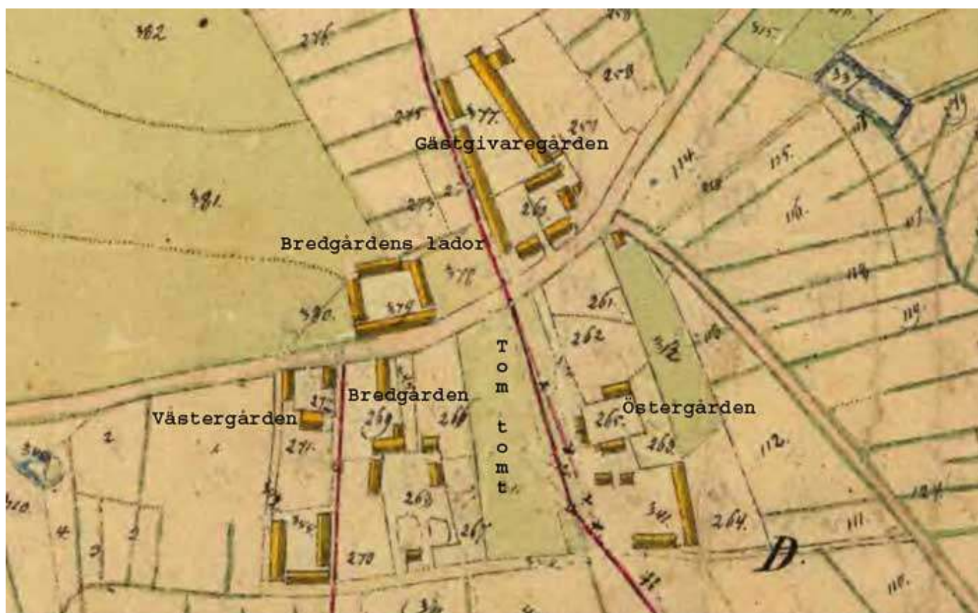
Laga skiftes karta 1843 med mina texter på

Under texten märkt tom tomt låg tidigare Fristads skattegård/gästgivaregård enligt karta 1650.