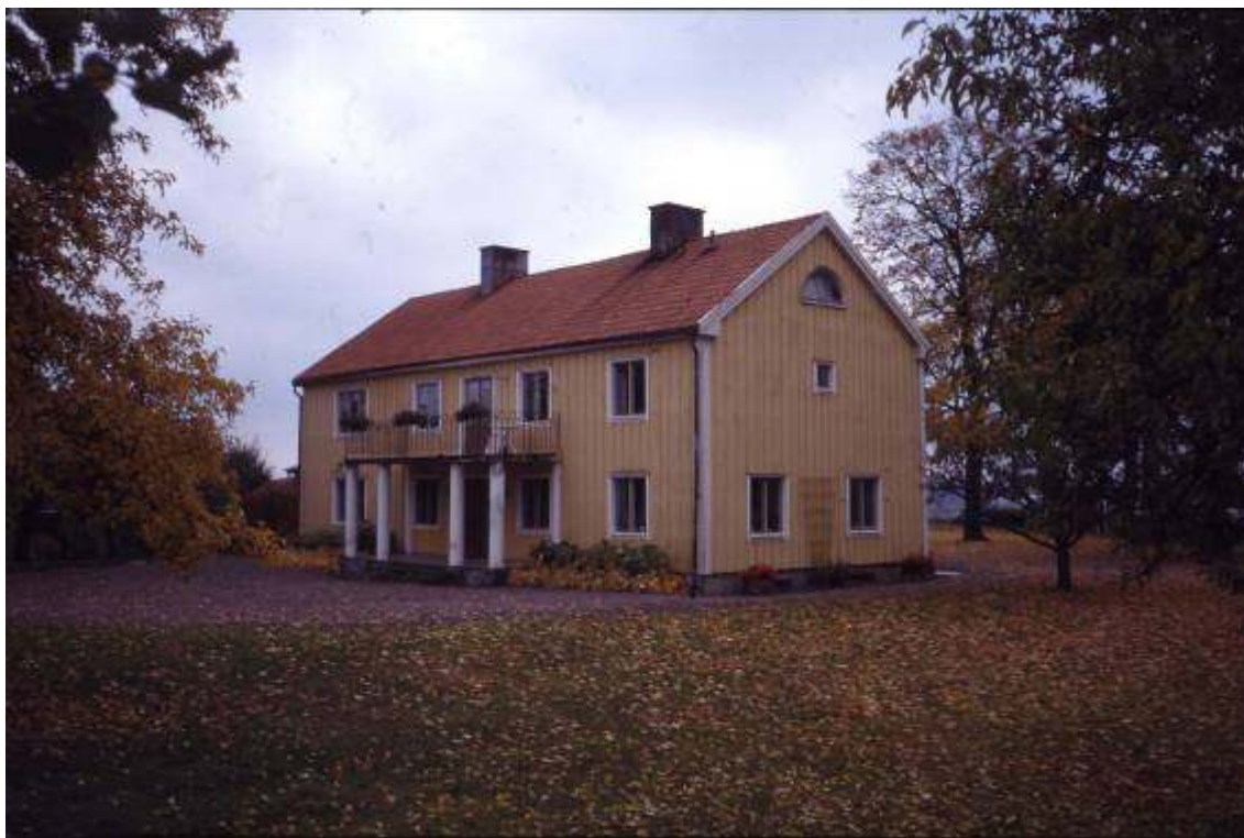
1980-90 tal, bild av Stig Turevik