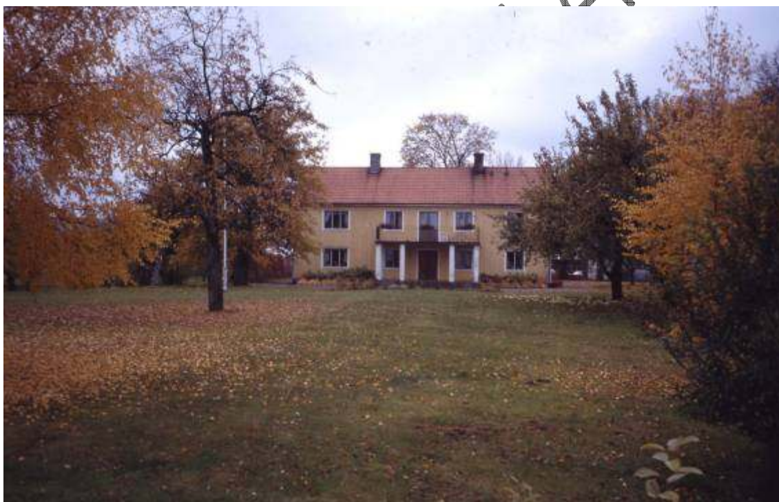
1980-90 tal