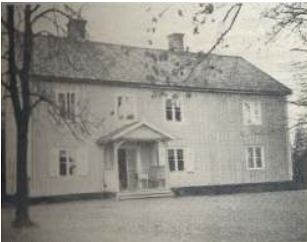
Östergården till höger i bilden